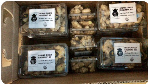
- Clamshells 450gr