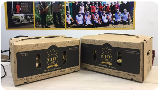
- 5 kg / 13 kg