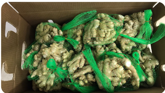
- 29 meshes of 1 lb each