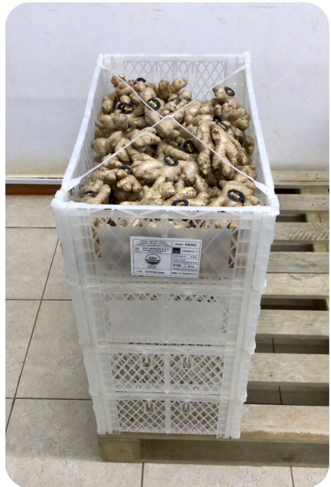
-7.5kg plastic boxes